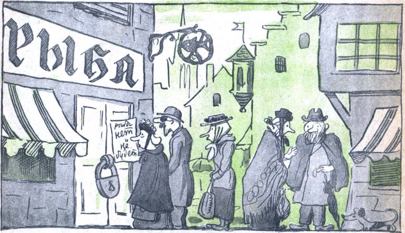
В НЕМЕЦКОМ ГОРОДЕ — Опять рыбы нет!..