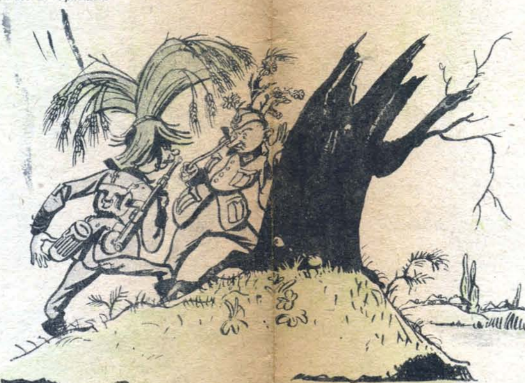
Рис. Б. Фридкина

— В этой деревне наши не были. — Почему ты думаешь, Фриц? — Я слышу пение петуха из деревни.