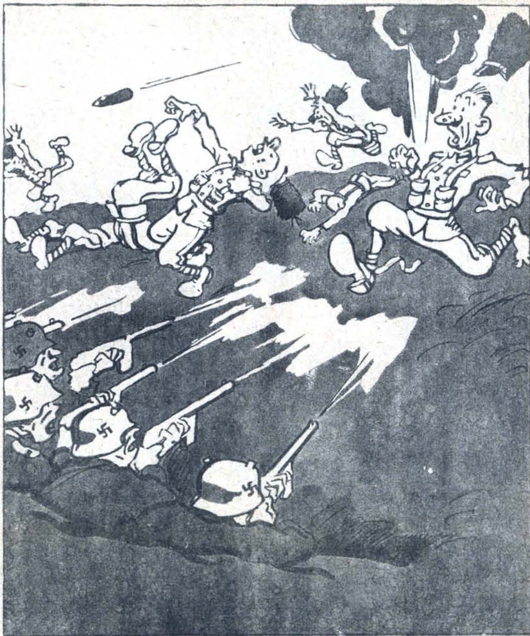
«Отступление 7-й венгерской дивизии доблестно отбито нашими частями».