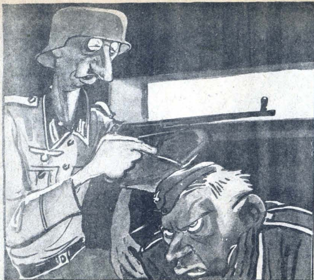
Рис. К. Елисеева

— Почему ты так дрожишь, Шульц? — Понимаешь, почему-то земля дрожит от русской артиллерии, вот и я с ней 'дрожу за компанию.