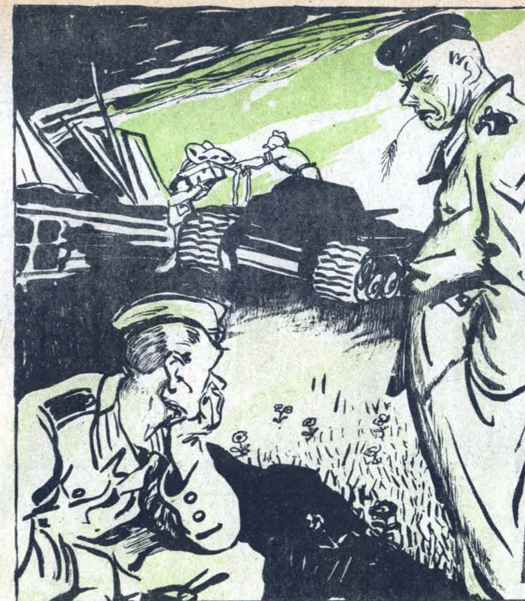
Рис. Б. Кляича

— Послушай, Ганс, говорят пехоте больше всего достается! — Какой там! Самое ценное забирают танкисты..