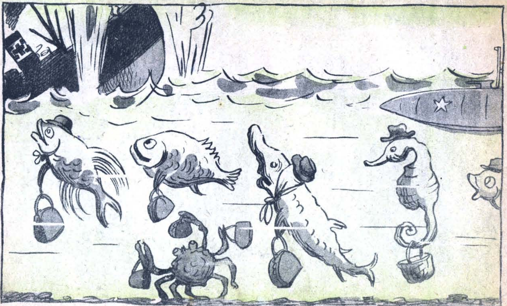
НА ДНЕ БАРЕНЦОВА МОРЯ . — Опять сегодня немца будут выдавать!.