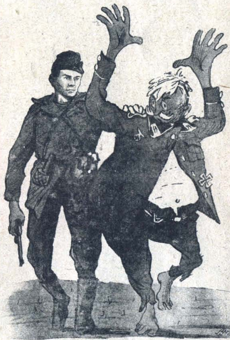
Корреспондент «Партизанской правды» тов. К. взял беседу у немецкого коменданта для очередного номера газеты.

В браиских лесах партизаны издают газету «Партизанская правда».